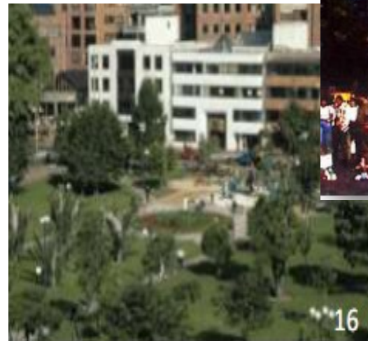
Parque de la 93