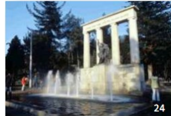
Escultura de Rafael Uribe Uribe. Parque Nacional