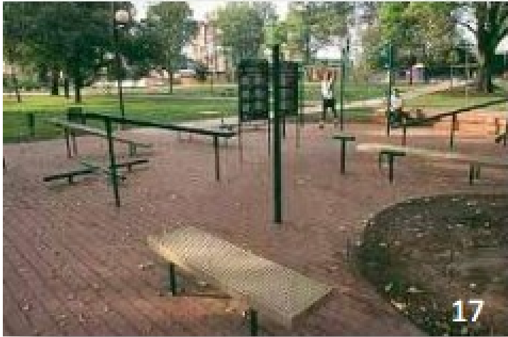
Parque de El Virrey

Parques que son potencialmente escenarios culturales y otros como la Plaza de Lourdes, los Hippies y hasta el parque de la 93 y el Virrey, ya posicionados como tales.