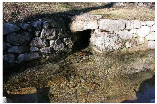
Una de las fuentes del Cardener