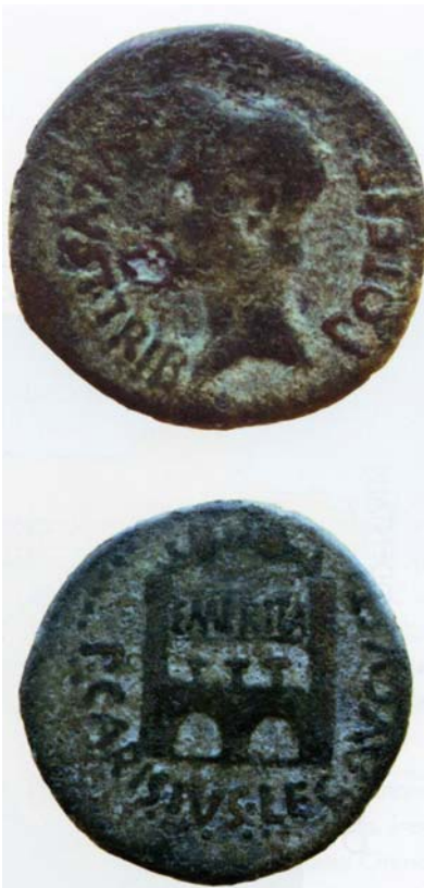
Anverso e reverso dunha moeda do legado de Augusto P. Carisio, procedente de Mérida (MNAR)

No ano 27 a.C. sublévanse de novo, o que motivou unha nova intervención de Sexto Apuleyo , que os volve vencer, pero estes triunfos eran máis propagandísticos ca reais, o que obriga a Augusto a intervir persoalmente. Este e os seus xenerais serán os que realicen a conquista do noroeste coas chamadas Guerras Cántabras , que se inician no ano 29 a.C. e terminan no 16 a.C.