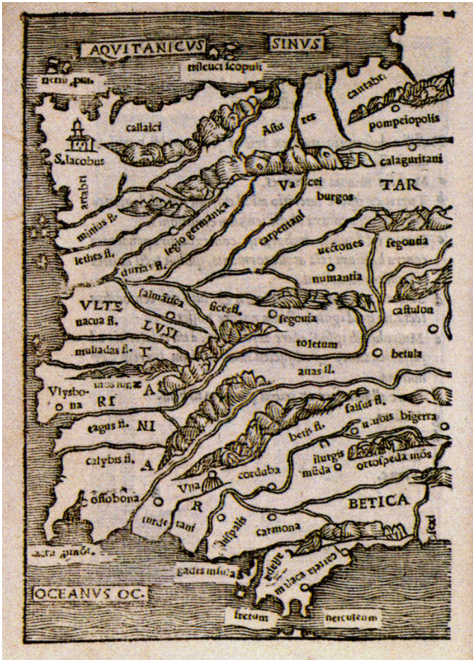
Mapa: C. Julii Caesaris rerum ab se gestarum comentarii (París, 1560) Biblioteca USC. Obsérvase o río Lethes (Limia) e o Minus (Miño)

Xulio César leva a cabo, non unha grande expedición de conquista terrestre-marítima, como defenden algúns investigadores, senón unha razzia costeira con varios desembarcos e áxiles incursións cuxa única finalidade sería o botín.