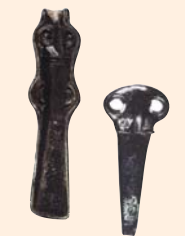
Moldes de hachas hechas en bronce