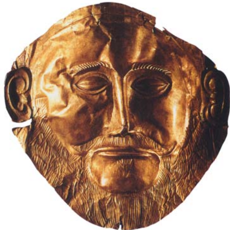
Máscara de Agamenón

Durante este periodo prehistórico, el hombre comenzó a utilizar el cobre. El Calcolítico se caracteriza por la nueva técnica de la metalurgia.