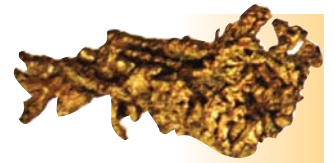
Pepita de oro nativo