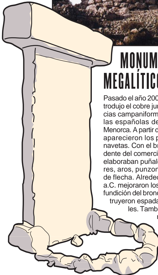
Taula de Torralba en Menorca

Pasado el año 2000 a.C., se introdujo el cobre junto a influencias campaniformes en las islas españolas de Mallorca y Menorca. A partir del 1700 a.C., aparecieron los poblados de navetas. Con el bronce procedente del comercio exterior se elaboraban puñales triangulares, aros, punzones y puntas de flecha. Alrededor del 1400 a.C. mejoraron las técnicas de fundición del bronce y se construyeron espadas y pectorales. También se erigieron los talayots.