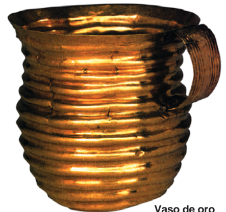
Vaso de oro

Hacia el año 3000 a.C., los nuevos pobladores del Mar Egeo empleaban el bronce para sus armas y herramientas, iniciándose así la Edad del Bronce en la zona. Durante esta época se fabricaban puntas de lanza, espadas y cuchillos.