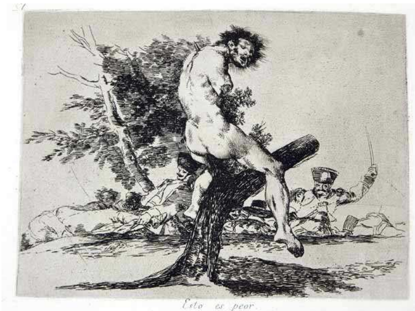
La crueldad del enfrentamiento quedó patente en la serie Los desastres de la Guerra de Goya .

francesa. Napoleón retiró más hombres para asegurar la defensa de Francia. Las tropas francesas en España, en consecuencia, iniciaron el repliegue hacia su país, mientras Wellington emprendía la ofensiva final. En la batalla de Vitoria (junio de 1813) eran derrotados los franceses y José I se vio obligado a cruzar la frontera. Todavía se mantenía Soult ocupando San Sebastián y Pamplona, pero derrotado en la batalla de San Marcial (agosto de 1813) tuvo también que pasar a Francia.