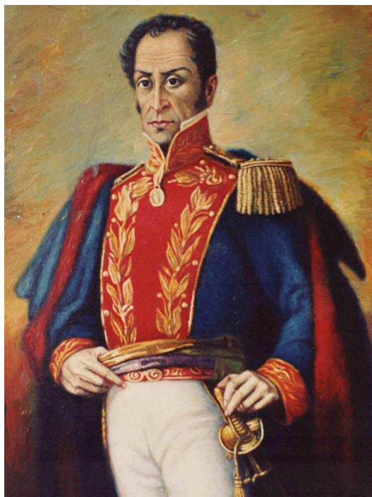
Simón Bolívar (1783-1830).

La independencia de las colonias no solo cerró tres siglos de unión política entre la metrópoli y América, sino que originó profundas transformaciones a ambas orillas del Atlántico. España se quedó convertida en una potencia de segundo orden y económicamente maltrecha por perder los recursos que venían de la Indias, así como sus ricos mercados. Las nuevas repúblicas fueron presa fácil del neocolonialismo de potencias como Estados Unidos y Gran Bretaña, pero también las disputas territoriales entre ellas contribuyeron a consolidar su identidad nacional.