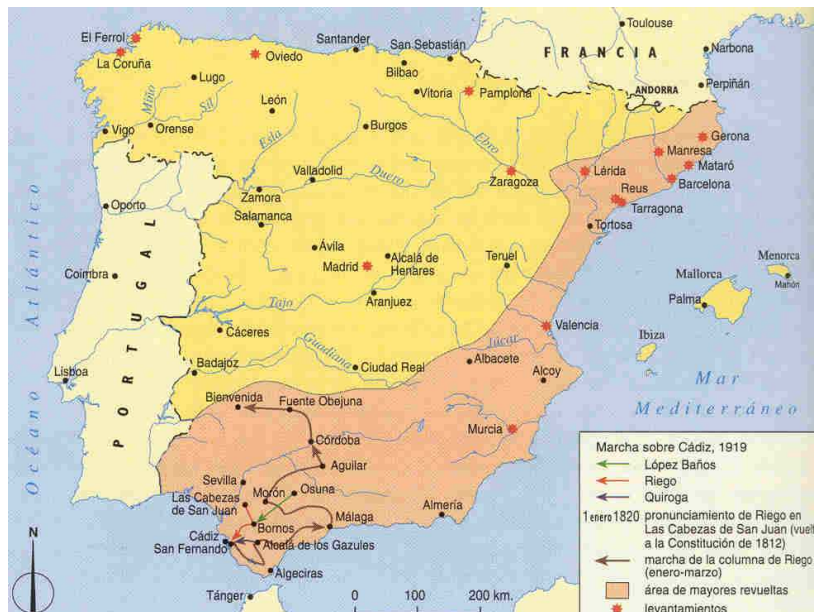
El levantamiento de Riego y su extensión.

Una solución que demostraba como los liberales se mostraban en esta cuestión más moderados que revolucionarios. Y también viene a explicarnos la postura antiliberal que apareció entre el campesinado, que veía ante sus ojos como se consolidaba la gran propiedad.