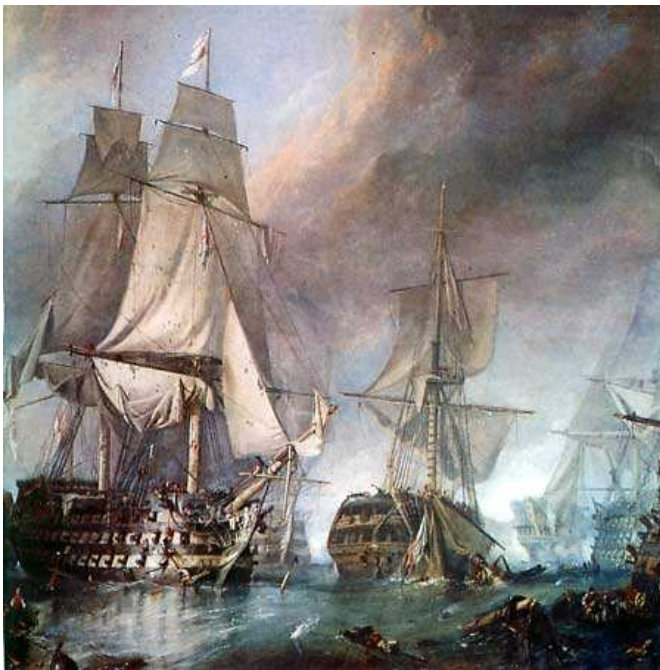
Representación de la batalla de Trafalgar.

Entre tanto la situación económica era desastrosa: malas cosechas, carestías y, fruto de ello, un riesgo de bancarrota para las finanzas reales, que no podían cubrir las deudas y gastos. Todo ello se intentó solucionar con una subida de impuestos –lo que motivó que aumentara el descontento contra Godoy- y con la primera desamortización de bienes de la iglesia , aprobada en 1798. Se trataba de expropiar y vender los bienes raíces que la Iglesia destinaba a obras de beneficencia, destinando su importe a cubrir los gastos de la deuda pública (vales reales).