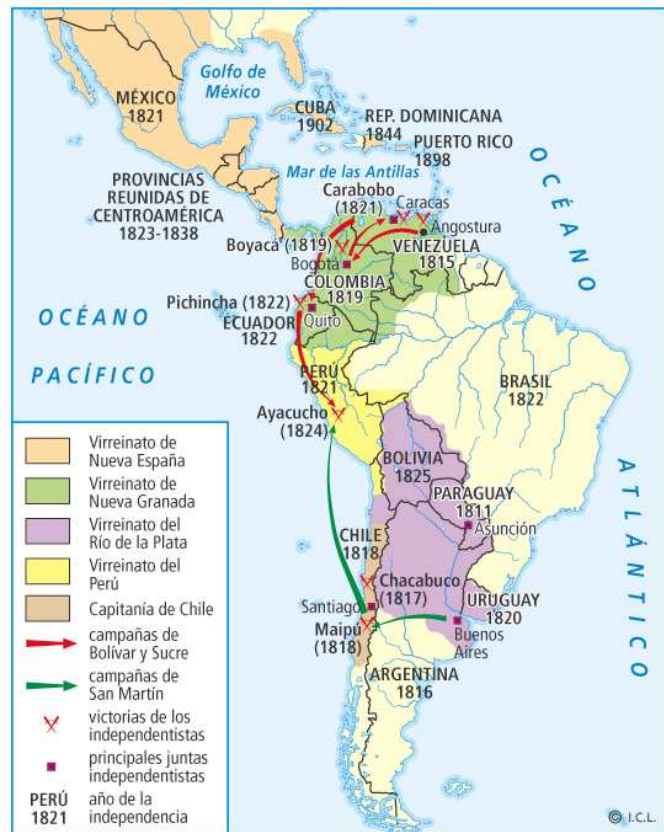
La emancipación de la América española.

- Primer periodo que llega hasta 1816 , en que casi queda dominada. Coincide en gran parte con la Guerra de la Independencia en España. A partir de 1808, al hundirse el aparato