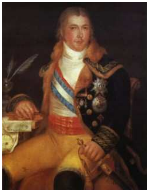
Manuel Godoy (1767-1851).

quien facilitó el acceso al poder a Manuel Godoy, un hidalgo extremeño que en poco tiempo pasó de oficial de palacio (Guardia de Corps) a Teniente General y Grande de España, y todo ello gracias al desmedido apoyo de la reina. Un año después de iniciado el reinado estalló la Revolución francesa, hecho que incidió en la política interior y exterior de España. Un rey débil y sin carácter, la situación de España requería un monarca con ideas, dispuesto a implicarse en el gobierno del país y a no caer en la dinámica de dejar las cosas en manos de sus ministros, como así hizo desde el principio del reinado.