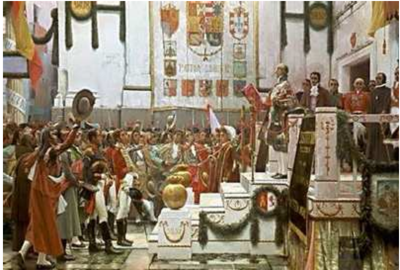
La promulgación de la Constitución de 1812. S.Viniegra y Lasso.

Por último, la Constitución acababa con la antigua división en reinos, estableciéndose la uniformidad y centralización administrativa con una nueva división de España en provincias. Se recuperaba para el Estado los cargos públicos que muchas personas, como ocurría en los Ayuntamientos, habían adquirido por venta y que transmitían en sus herederos.