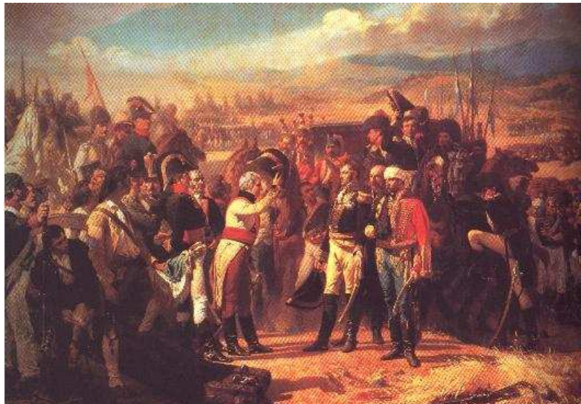
Dupont se rinde en Bailén ante Castaños. Casado de Alisal. 1864.

La guerra se desarrolló en tres fases. La primera de ellas, o de los éxitos iniciales españoles, tiene lugar entre los meses de junio y noviembre del año 1808, tras el fracaso del levantamiento de Madrid. En este período los soldados franceses se emplearon en sofocar los alzamientos urbanos que se