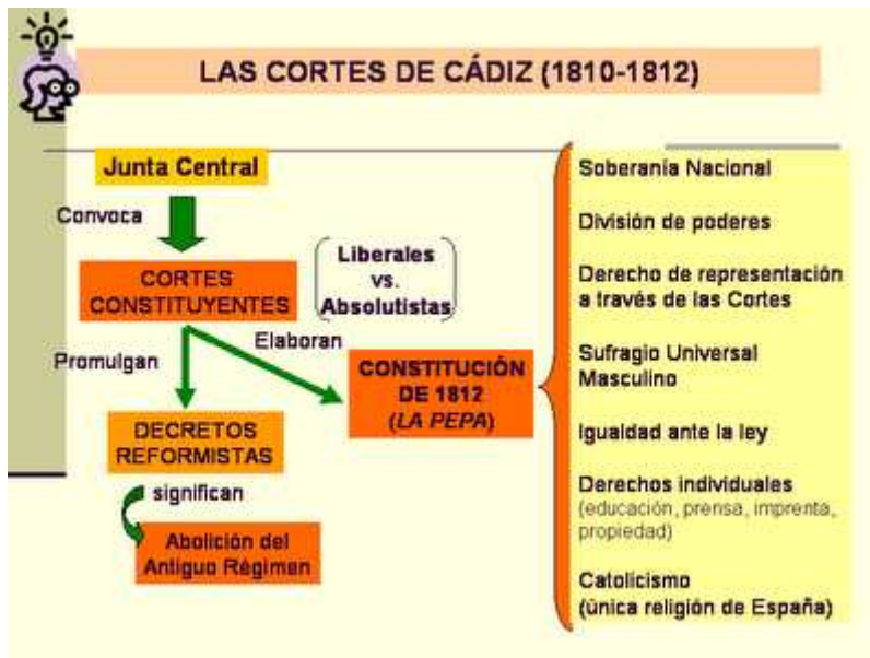
Las Cortes de Cádiz y su obra.