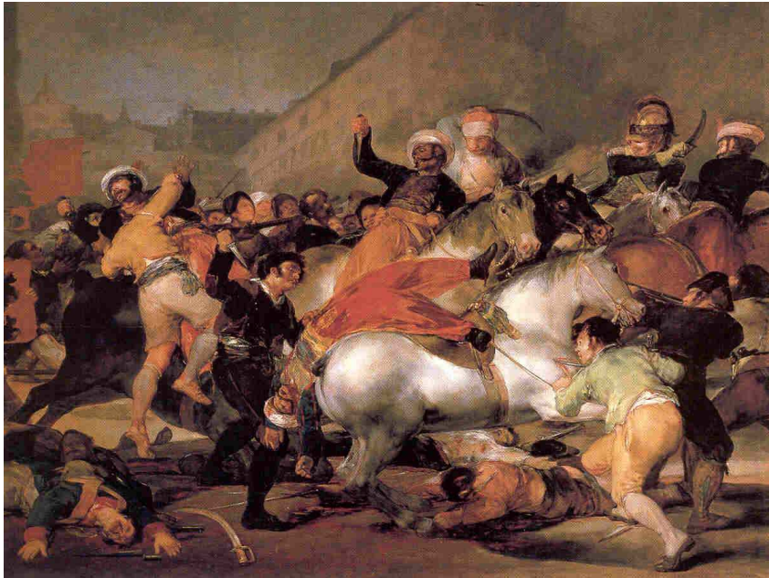
La carga de los mamelucos o El dos de mayo. Goya, 1814.

por el que se prohibía todo comercio del continente europeo con Inglaterra. El objetivo era cerrar todas las costas europeas al comercio inglés provocando la ruina de la industria inglesa y con ello la miseria y la rendición final. Para hacer efectivo el bloqueo en Portugal , aliado de Inglaterra, Napoleón firmó con España el tratado de Fontainebleau (octubre de 1807), por el que se autorizaba al ejército francés a atravesar España camino de Portugal. A su vez, se incorporaba un