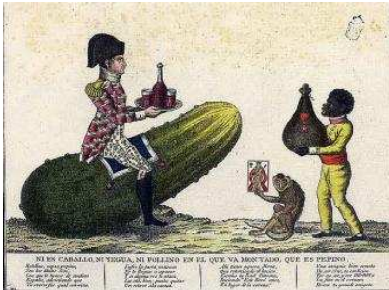
Grabado popular satirizando al rey José I Bonaparte.

intervenir contra los franceses; solo algunos oficiales, como los capitanes Luis Daoiz y Pedro Velarde desobedecieron las órdenes, se unieron a la rebelión popular y perecieron defendiendo el Parque de Artillería de Monteleón. El ejército francés, al mando del general Murat , lugarteniente de Napoleón en España, con un ejército de 30.000 hombres reprimió duramente el levantamiento popular, con un saldo de cientos de muertos: en la noche del 2 al 3 de mayo un centenar de prisioneros eran fusilados, inmortalizados por Goya, en la montaña de Príncipe Pío y en la Moncloa.