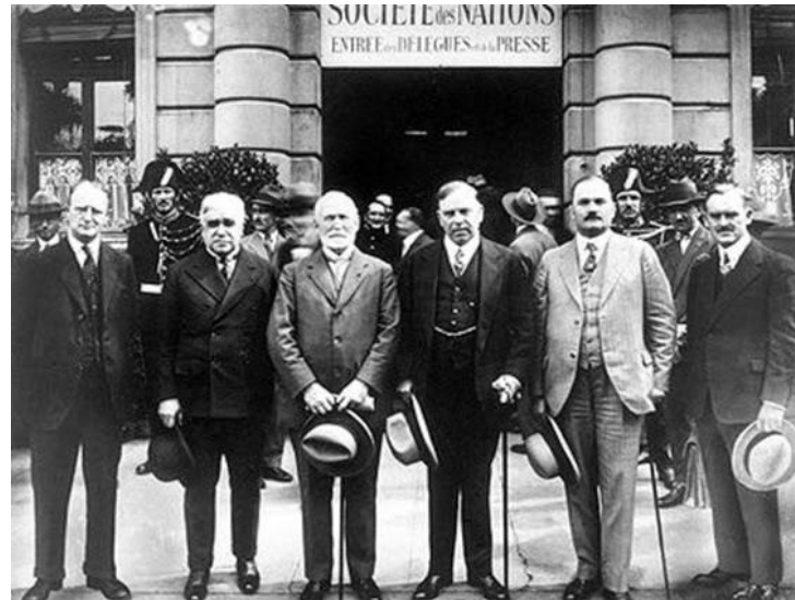
Uno dei convegni della Società delle Nazioni

Il maggiore promotore della Società delle Nazioni fu il presidente degli Stati Uniti Thomas Woodrow Wilson che per questo impegno fu insignito del premio Nobel per la pace nel 1919.