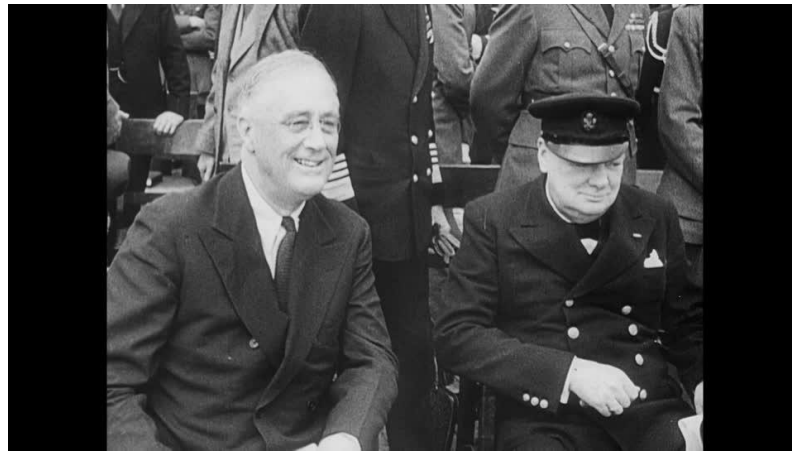
Roosevelt e Churchill alla firma della Carta Atlantica

Un passo fondamentale per la creazione dell'ONU fu la stipulazione della Carta Atlantica, che prendeva ispirazione dai vecchi "14 punti" programmatici di Woodrow Wilson, da parte del presidente degli Stati Uniti Franklin Delano Roosevelt e del primo ministro britannico Winston Churchill; l'evento si svolse il 14 agosto del 1941 a bordo della nave da guerra HMS Prince of Wales al largo di Terranova.