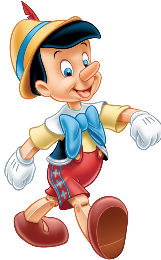
Illustrazione dell'adattamento cinematografico di Walt Disney del 1940