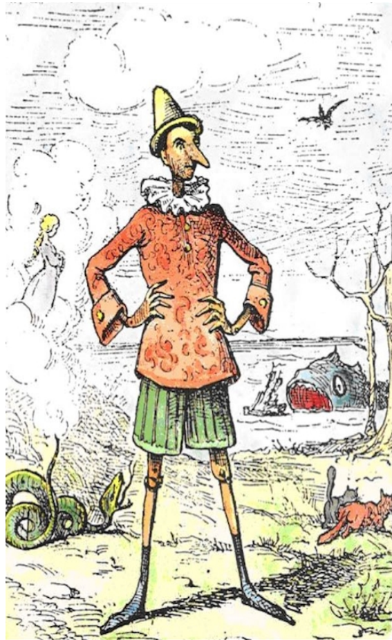
Illustrazione originaria di Mazzanti intorno al 1882