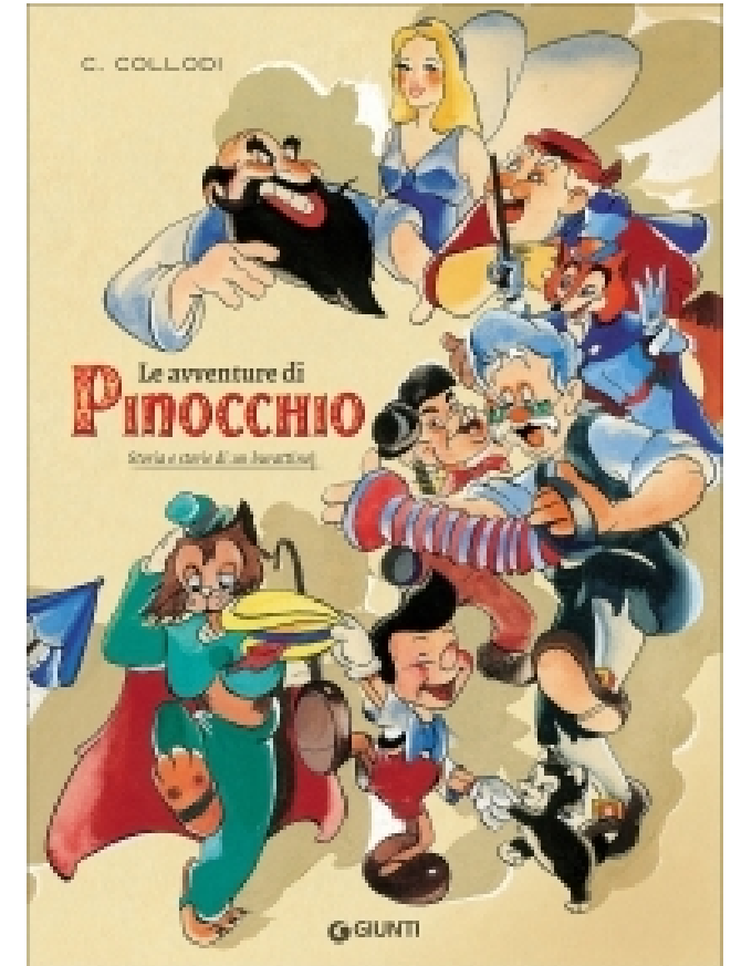
Le avventure di Pinocchio. Storia e Storie di un Burattino, ed. Illustrata dallo Studio IPI nel 1940 per ed. Marzocco (riedite da Giunti, 2016)