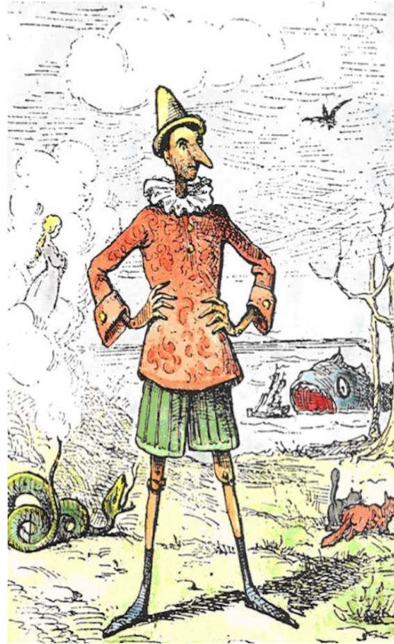
Illustrazione originaria di Mazzanti intorno al 1882

Collodi, pseudonimo di Carlo Lorenzini, pubblicò l'opera a puntate, quasi per caso e senza troppa voglia, sulla prima annata del 1881 del Giornale per i bambini diretto da Ferdinando Martini, un periodico settimanale supplemento del quotidiano Il Fanfulla .