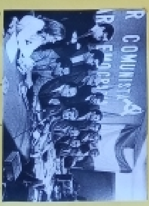
Legislación Benito González

La democracia se celebra el 20 de agosto de 1978. Los españoles eligieron a Juan Carlos I como Rey de España y a Sofía de Grecia como Reina. Este día se celebró la proclamación de Juan Carlos I como Rey de España y la aprobación de la Constitución de 1978.