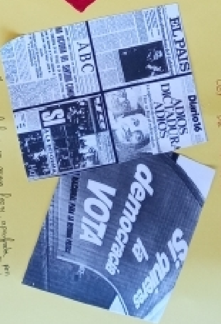
Lev de la Guardia Bañica

En julio de 1976 tras la huida de Adolfo Suárez al extranjero, Franco fallece el 20 de agosto de 1976. Su hijo Juan Carlos I se proclama Rey de España y nombra a Adolfo Suárez como primer ministro de España.