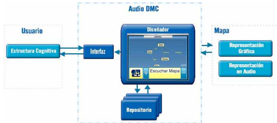
Figura 2: Modelo de AudiodMC

Modelo. La figura 2 muestra la arquitectura de AudiodMC. Los componentes de este modelo son: 1. Usuario , que construye el mapa conceptual, 2. Diseñador , que corresponde al editor de mapas conceptuales y provee al usuario distintas funcionalidades para construir el mapa basado completamente en sonido, 3. Interfaces , conjunto de dispositivos de Entrada/Salida (el teclado, la representación gráfica y el sistema de audio) que permiten la interacción del usuario con AudiodMC, 4. Mapas , conjunto de nodos y relaciones que el aprendiz ciego genera con AudiodMC y que son representados en audio y, simultáneamente, en formato gráfico, y 5. Repositorio , contenedor de los mapas diseñados por el usuario para su posterior modificación o evaluación.