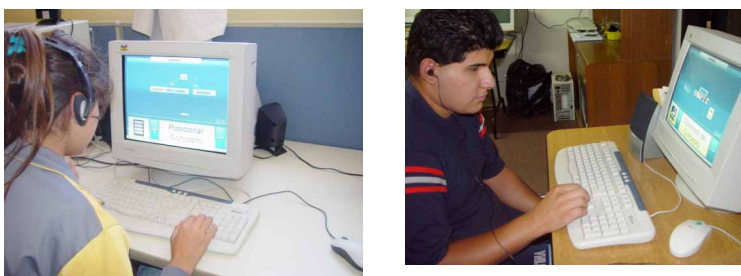
Figura 6: Usuarios no videntes construyendo mapas conceptuales con AudiodMC

Los 12 participantes evaluaron como bueno o muy bueno todos los componentes de la interfaz, a excepción del componente efectividad de sonido de jerarquización de conceptos, en el que 8 aprendices lo evaluaron como deficiente o muy deficiente, realizando además sugerencias cruciales para un entendimiento y control del uso de los elementos de la interfaz de AudiodMC, como por ejemplo, hacer que la voz sea más placentera, que el sonido avance más lento, que las diferencias entre los sonidos usados en la escala sean más marcadas para favorecer la referencia de la posición de los conceptos en los diferentes niveles de la jerarquía.