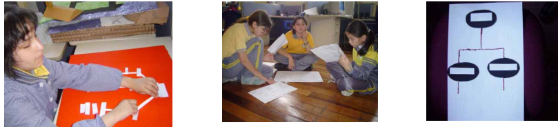
Figura 1: Usuarios no videntes construyendo mapas conceptuales con material concreto

el 27% es limítrofe. El 100% de ellos maneja el teclado. El 82% utiliza eficientemente el sistema lectoescritor braille o macrotipo según sea su discapacidad visual. El 73% de ellos son mujeres y el 27% hombres. El promedio de edad fue de 11 años. Un 9% eran aprendices menores de 10 años, un 55% entre 10 y 13 años, y el 36% mayor de 13 años. El 27% poseía ceguera total y el 73% baja visión. Las actividades con los aprendices se llevaron a cabo en la Escuela de Ciegos Santa Lucía de Santiago, Chile.