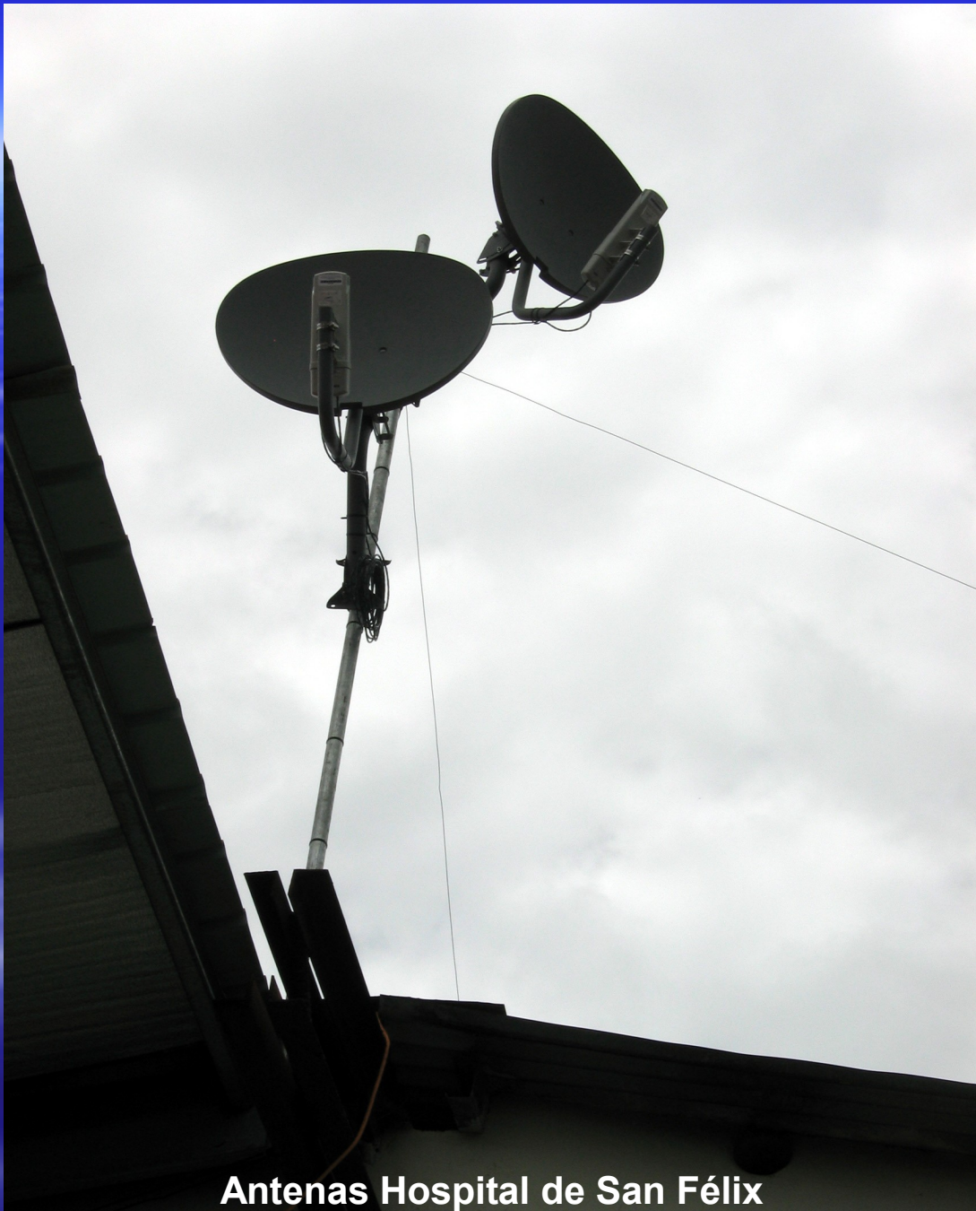
Antenas Hospital de San Félix