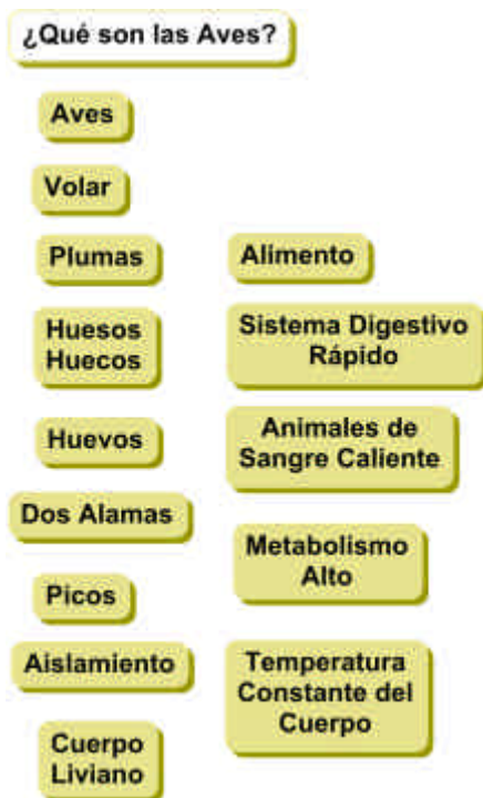
Figura 1. La Pregunta de Enfoque y el área de estacionamiento: conjunto inicial de conceptos para un mapa conceptual sobre Aves.

Dado un campo o tema seleccionado y una pregunta o problema definido en este campo, el siguiente paso es identificar los conceptos clave que se aplican a este campo (vea una explicación sobre los conceptos en el documento complementario ¿Qué es un Concepto? ... desde la Perspectiva de los Mapas Conceptuales ). Usualmente bastará con 15 ó 25 conceptos. Recomendamos usar el menor número posible de palabras, generalmente una sola, para cada concepto que se introduzca. La Figura 1 brinda un ejemplo de un conjunto inicial de conceptos para un mapa conceptual sobre las Aves. La forma más fácil de hacer esta lista y elaborar un mapa conceptual a partir de ella es utilizar un programa de software tal como IHMC CmapTools (Cañas et al., 2004, http://cmap.ihmc.us ). Nos referimos a esta lista de conceptos como un área de estacionamiento , puesto que poco a poco pondremos estos conceptos en el mapa conceptual al determinar dónde encajan. Algunos conceptos pueden permanecer en el área de estacionamiento al completarse el mapa si la persona que construye el mapa no ve ninguna buena conexión para ellos con otros conceptos del mapa. Puede que se identifica conceptos importantes adicionales conforme se elabora el mapa.