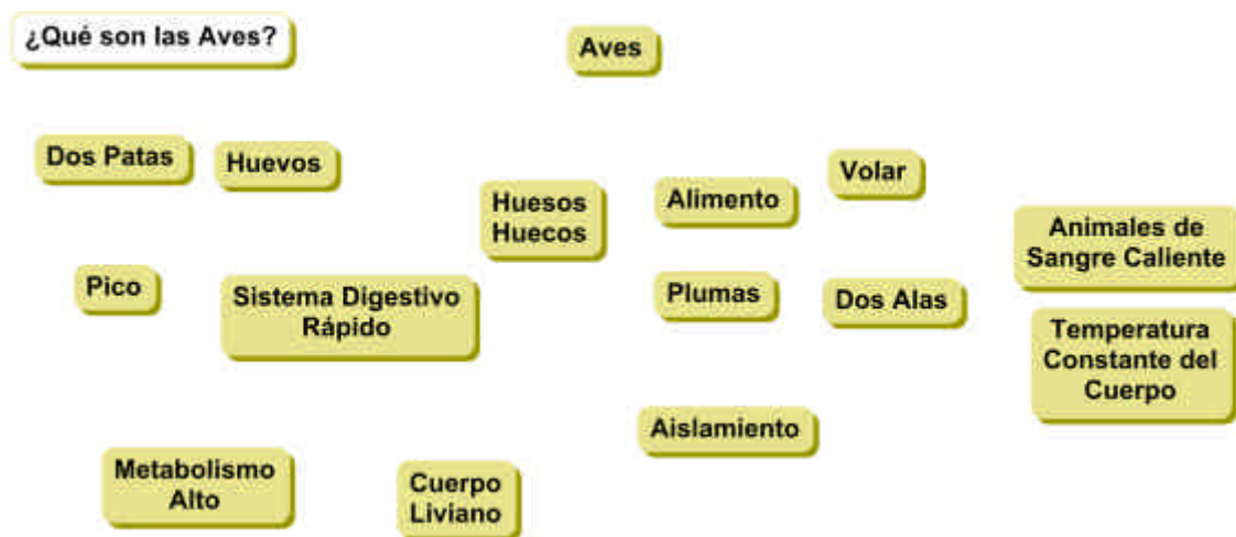
Figura 2. Los conceptos están ahora colocados en una clasificación aproximada del más general al más específico de arriba a abajo y se pueden desplazar sobre el lienzo para empezar a formar el mapa.

Los conceptos enumerados en el área de estacionamiento se pueden organizar ahora en una lista ordenada desde el concepto más general e incluyente para este problema o pregunta particular en la parte superior hasta el concepto más específico y menos general en la parte inferior de la lista. Este ordenamiento jerárquico es un primer intento por organizar los conceptos, pero nos ayuda a empezar el proceso de elaboración de mapas. Esta clasificación puede tomar la forma de una lista o se puede usar una ubicación aproximada para algunos de los conceptos del mapa, como se muestra en la Figura 2. Los conceptos se pueden trasladar fácilmente con CmapTools, de modo que esta colocación es solo una forma de arrancar.