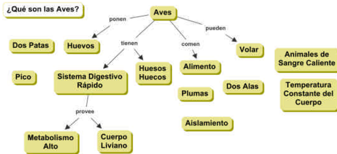
Figura 3. Se agregan palabras de enlace para unir los conceptos y formar proposiciones.

con varias palabras posibles de enlace al vincular dos conceptos en un intento por crear las proposiciones más claras y fáciles de entender en cada caso. La Figura 3 muestra las primeras palabras de enlace que se agregan a los conceptos de la Figura 2.