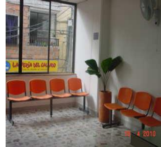
Sala de espera