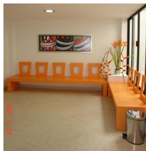
Sala de Espera