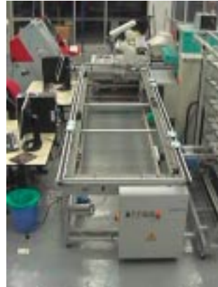
b) Banda transportadora y Centro de mecanizado