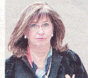
IRENE RIGAU Consellera de Ensenyament

car a partir de marzo una “solución coordinada” con todas las autonomías para que se apliquen los planes conjuntos previstos. Gabilondo insistió en que se está viviendo “una situación económica compleja” y prometió buscar “una respuesta para las necesidades” de cada autonomía.