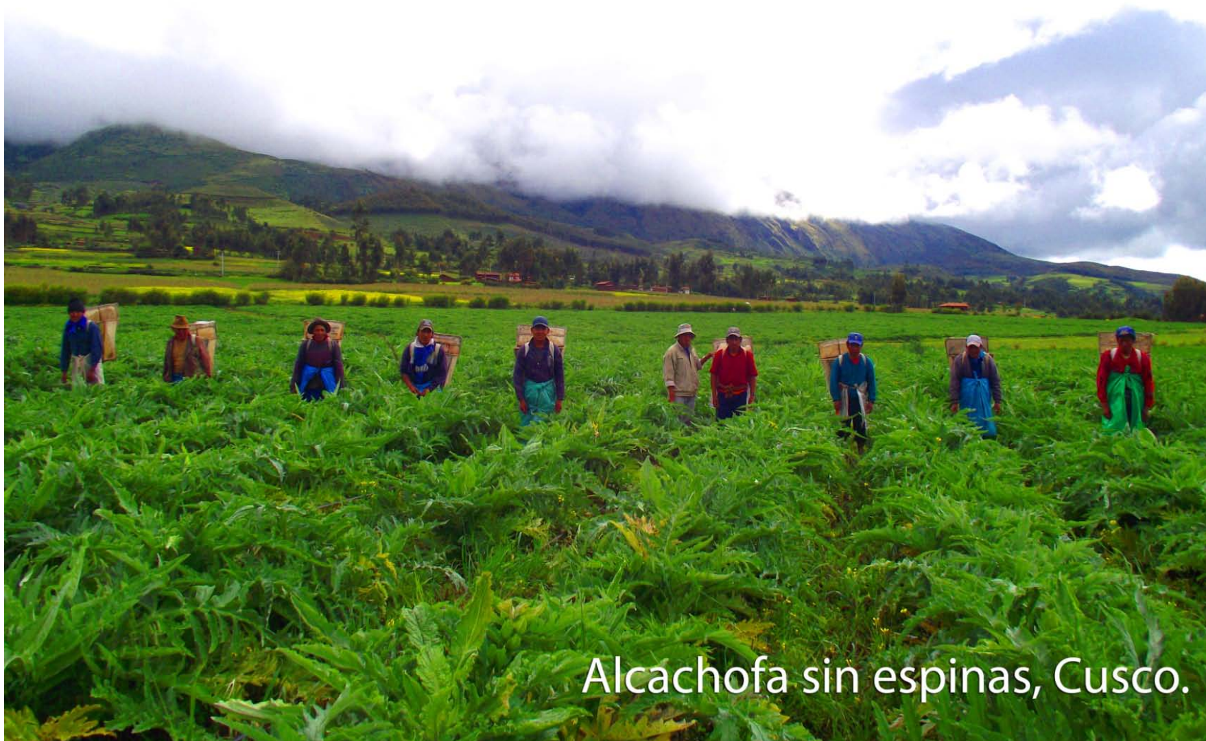
Alcachofa sin espinas, Cusco.