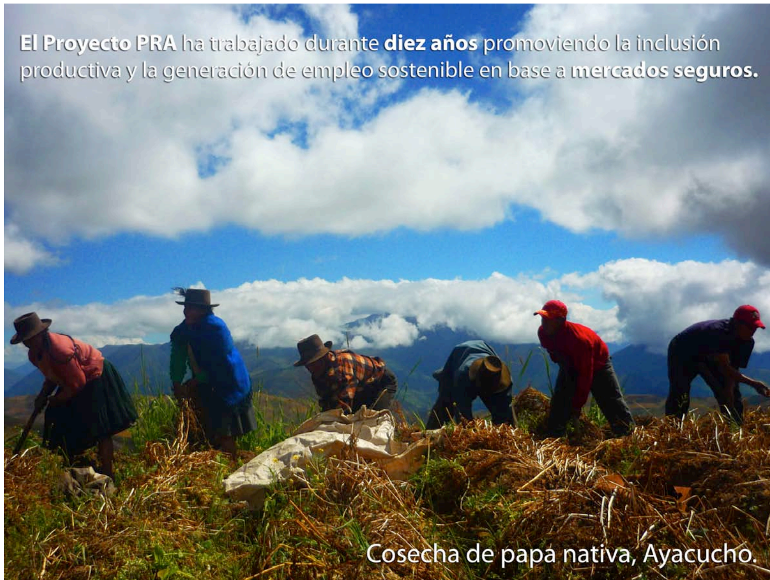
Cosecha de papa nativa, Ayacucho.

El Proyecto PRA ha trabajado durante diez años promoviendo la inclusión productiva y la generación de empleo sostenible en base a mercados seguros .