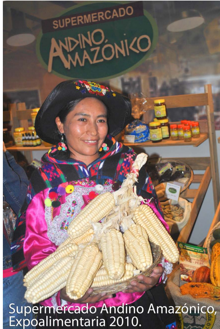
Supermercado Andino Amazónico, Expoalimentaria 2010.