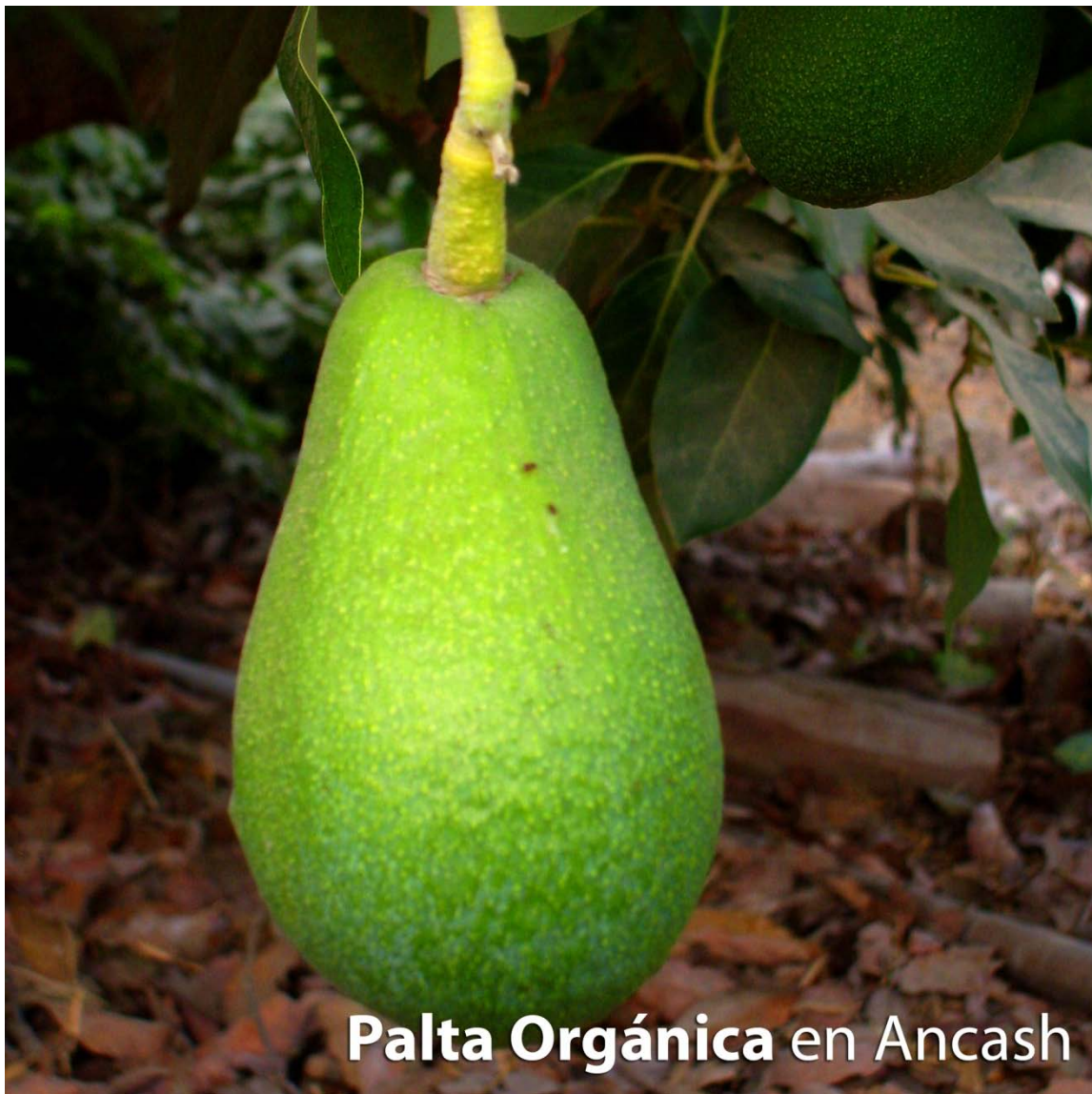
Palta Orgánica en Ancash