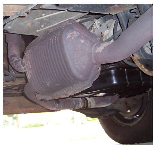
Convertidor catalítico de un automóvil.

De todas formas debido a la imposibilidad de controlar totalmente el proceso de la combustión, se siguen generando gases nocivos. Para reducirlo (hasta un 75%) existe el catalizador . Éste se ubica muy cerca del colector de escape (para que los gases tengan al menos unos 400 °C).