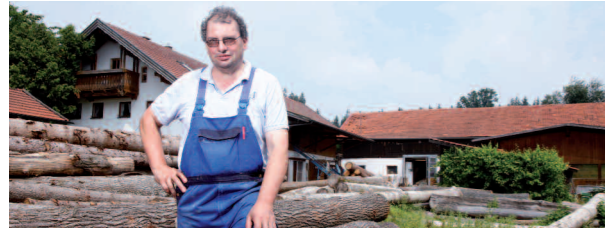
Holzverarbeitender Betrieb, Landshut, Bayern Verarbeitung von 1.000 bis 1.500 Kubikmeter Holz