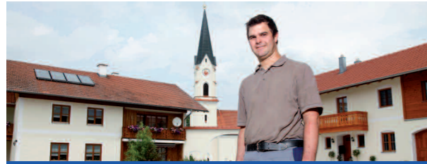
Ferkelzüchter, Landshut, Bayern 300 Zuchtsauen, Stallfläche 1.200 qm

Spanner Holz-Kraft®-Anlagen haben sich im jahrelangen Dauerbetrieb und in verschiedensten Anwendungen, wie Landwirtschaft, Forstwirtschaft und Nahwärmenetzen bereits hundertfach bewährt.