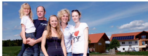
Nahwärmenetzbetreiber, Ebersberg, Bayern Netzlänge von 870 m, versorgt 13 Gewerbebetriebe und 27 Privathaushalte