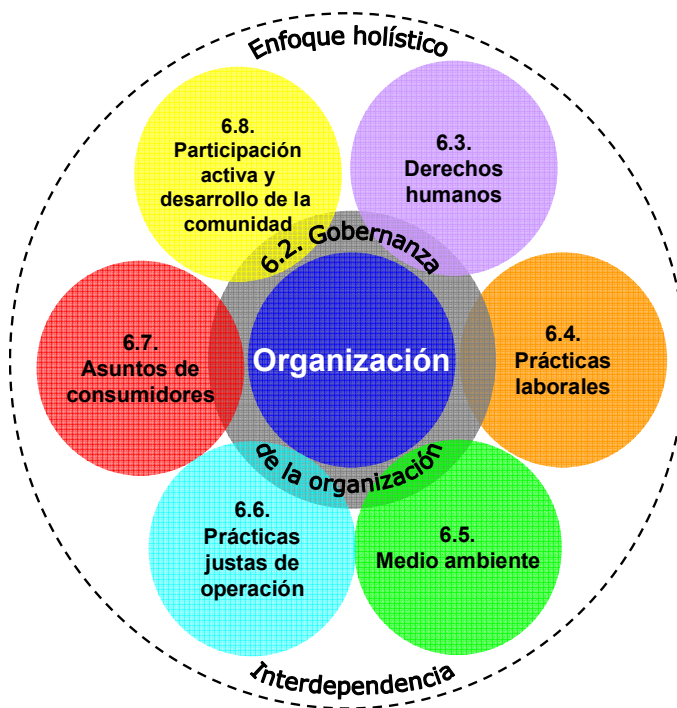
Figura 3 — Las siete materias fundamentales

El capítulo 7 ofrece mayor orientación acerca de la integración de la responsabilidad social.