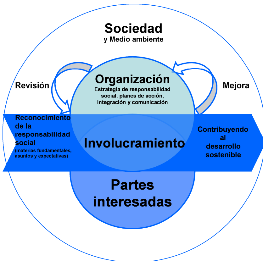
Figura 4 — Integración de la responsabilidad social en toda la organización

Puede que algunas organizaciones ya hayan establecido técnicas para introducir nuevos enfoques en su toma de decisiones y sus actividades, así como sistemas eficaces de comunicación y revisión interna. Otras puede que tengan sistemas menos desarrollados para la gobernanza de la organización u otros aspectos de la responsabilidad social. La siguiente orientación pretende ayudar a todas las organizaciones, cualquiera que sea su punto de inicio, a integrar la responsabilidad social dentro de su manera de operar (véase la Figura 4).