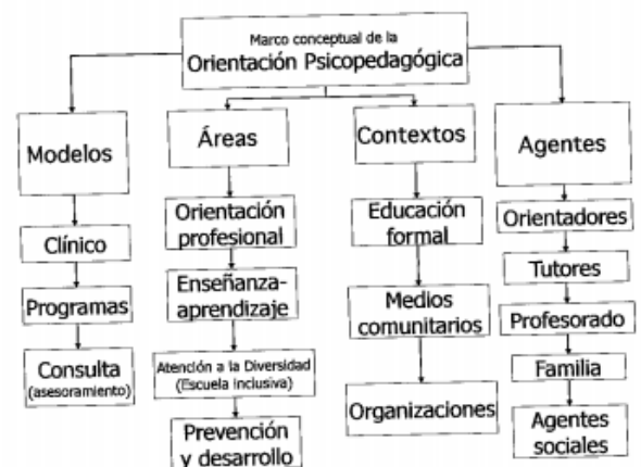
Cuadro 1.2. Marco conceptual de la orientación psicopedagógica

Parla d'acció orientadora és parlar d'una xarxa d'actuació en diferents professionals que es proposen un objectiu en comú.