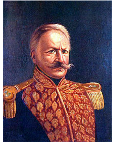
José María Obando fue designado como el primer Presidente del Estado de la Nueva Granada .