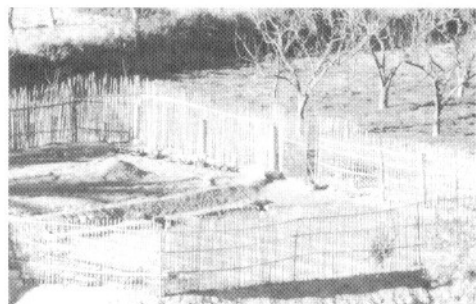
Pequeño huerto acotado a la vieja usanza con cañizo

salía con los amigos, también jubilados, y me juntaba con ellos. Íbamos al bar o al casino y jugábamos al dominó, pero sin dinero.