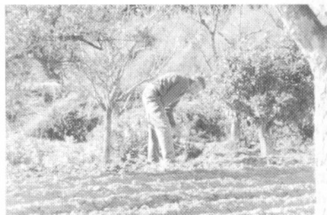
Huertano jubilado ejerciendo todavía en su tierra

Mi padre entonces se dedica a las tierras y yo le estuve ayudando también ahí. Cuando volví de la guerra, como mi padre ya no tenía el bar, nos dedicamos a trabajar en la tierra: a