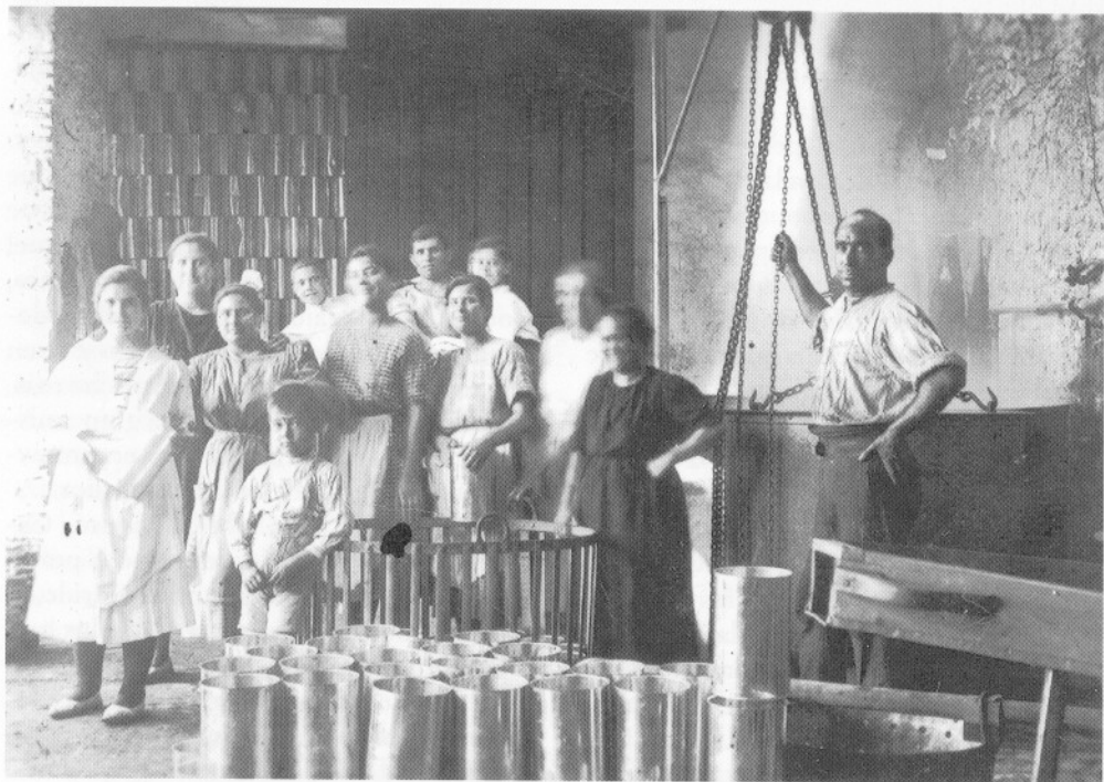
Proceso de cocido de botes de conserva cerrados. Interior Fábrica D. Pedro Cascales.

No es de extrañar que el valor de la producción total de la industria conservera durante el año 1950 en la provincia, se estimará por Vargar Turpín —queremos decir Turpín Vargas— en 224.471.084, cantidad que por sí misma nos dice la importancia de estos manipulados, y si agregamos el poder adquisitivo actual de la peseta, sumando los más de dos ceros, nos vamos a la cifra aproximada de los treinta mil millones de pesetas que no en ninguna tontería lo que el esfuerzo de nuestros empresarios han hecho junto con los agricultores de la región como riqueza mur-