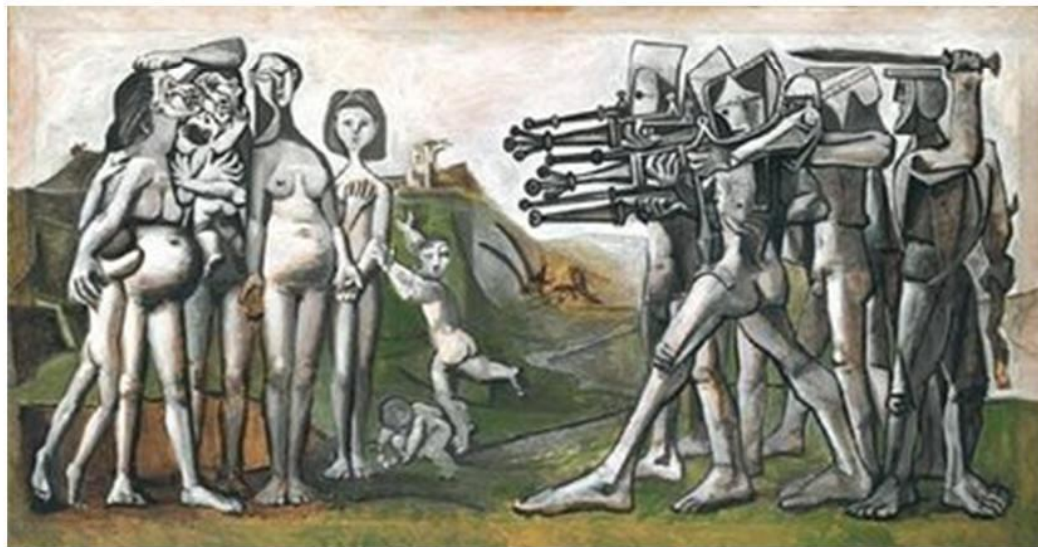
LA GUERRA SEGONS PICASSO