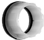
BUJE DE LEVA ESTRIADO 1 5/8 X 7/8 WA045008