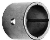
BUJE DE LEVA LISO EN BRONCE 1 1/2 X 1 1/2 WA045002