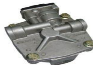
VALVULA RELAY TRAILER (MIDLAND) WAKN30300