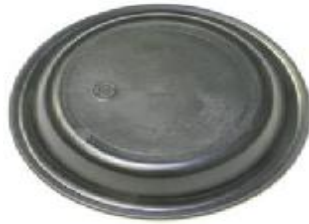
DIAFRAGMA TIPO 30 WAKN18300