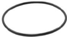
EMPAQUE COPA TAPA TRAILER INCA WA145001