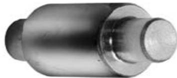
RODAJA BARRIL ANCHO DE 1 1/4 X WA075045