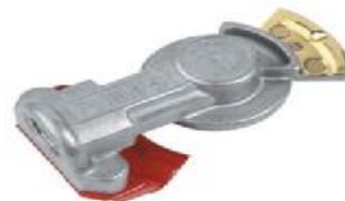
1.5 MANITO TRAILER ROJA WA11451