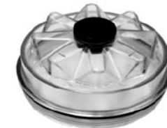
COPA TAPA TRAILER INCA WA3404975