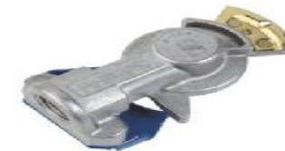
1.6 MANITO TRAILER AZUL WA11452