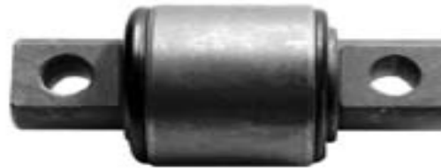
BUJE CORBATIN HENDRICKSON 2 3/4 WA125006