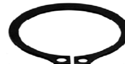
PIN LEVA 1 1/8 WA075002