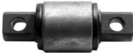
BUJE CORBATIN HENDRICKSON 2 17/32 WA125005