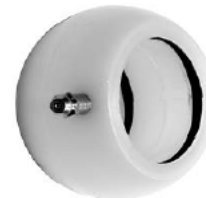
BUJE DE LEVA ESFERICO 1 5/8 X 1 1/2 WA045017