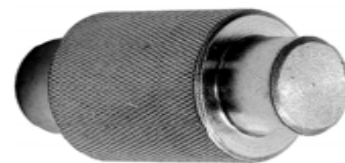
RODAJA BARRIL ANCHO DE 1 1/4 X 2 LABRADA WA075045