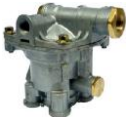
VALVULA RELAY TRAILER (SEALCO) WA110200