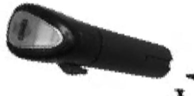
PERA DEL BAJO DOBLE A6915R WARFSW0527