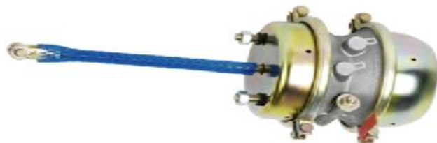
BOMBONAS TIPO 30/30 WA3030TC