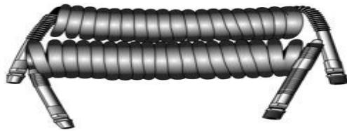
1.8 JGO MANGUERA ESPIRAL WA451036N