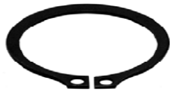
PIN LEVA 1 5/32 WA075000