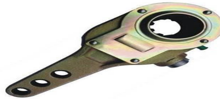
RATCHES ESTRIA FINA DE 28 ESTRIAS WAKN44071