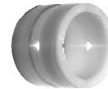
BUJE DE LEVA ESTRIADO 1 1/2 X 1 1/2 WA045001