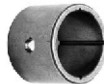
BUJE DE LEVA LISO EN BRONCE 1 5/8 X 1 1/2 WA045009