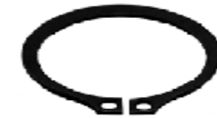
PIN LEVA 1 1/2 WA075003