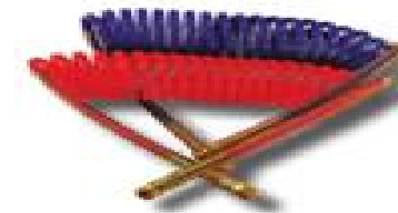
MANGUERAS TRAILER WA451036N