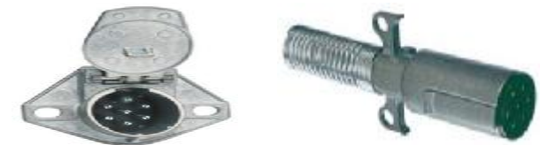
1.9 CONECTORES 7 VIAS MACHO/HEMBRA BK7555028-BK7555020