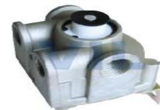
VALVULA RELAY R12 WA103009