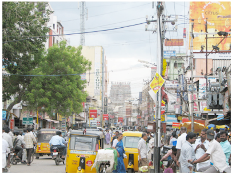
Una bulliciosa calle del centro de la ciudad.

Es el séptimo país más extenso del planeta , con 3.287.590 km 2 (España tiene una extensión de 504.645 km 2 ). Los países con los que comparte fronteras –Pakistán, Bangladesh, Nepal, Sri Lanka, Myanmar y China– viven conflictos internos desde hace años. Por tanto, la India se encuentra en un escenario estratégico delicado. La rivalidad con Pakistán a causa del territorio de Cachemira –un problema sin resolver– es un elemento fundamental de la inestabilidad regional y ha provocado varias guerras. Algo parecido, aunque en menor medida, sucede con China.