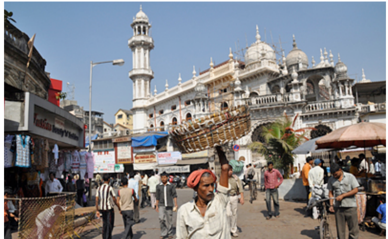
Templos suntuosos y pequeños comerciantes en una calle de Mumbai.

Dice Aaj Sahni (3) : “La Unión India constituye un sorprendente caso de contrastes. (...) Existe, entre la élite india, una enorme confianza, la seguridad y la certeza de quien se dispone a conquistar el mundo; (...) un sentimiento respaldado por un crecimiento sostenido de la economía, que entre 1993 y 2003 creció un constante 6 por ciento y en los últimos cuatro años ha alcanzado un notable 9 por ciento”. (4)