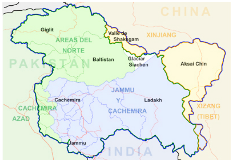
El valle de Cachemira, Jammu y Ladakh componen el estado indio de Jammu y Cachemira.

El atentado del Samjhauta Express fue un ataque terrorista que tuvo lugar el 18 de febrero de 2007 en ese servicio ferroviario que conecta Delhi (India) con Lahore (Pakistán). Las bombas estallaron en dos vagones llenos de pasajeros, a 90 kilómetros al norte de Nueva Delhi. En el incendio murieron 68 personas y 50 resultaron heridas . La mayoría de las personas fallecidas eran civiles pakistaníes, pero entre las víctimas había también civiles indios y personal militar indio que vigilaba el tren. Los conflictos entre extremistas hindúes y musulmanes continúan en la actualidad —atravesados por una mutua intolerancia religiosa, teñida de un nacionalismo exacerbado— y provocan numerosos atentados terroristas. Uno de los últimos fue el ataque al centro turístico de Mumbai, realizado en 2008 por un grupo extremista musulmán de Cachemira.