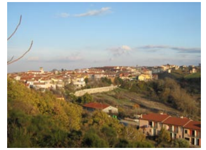
02 | Il centro urbano di Aquilonia (AV)

are to be upgraded and meet the new requisites of security, accessibility and energy efficiency. As part of a strategic programme of actions converging in a global sustainable project, the City Council has adopted the objectives of the PON 2007-2013 5 . Environmental awareness and the promotion of eco-efficient use of resources are seen as fundamental conditions for a better quality of life and for the enhancement of the local economy and employment. The general strategic guidelines for technological retrofitting of selected school buildings include restoring performance levels to their original values, enhancing performance and introducing new facilities through the use of innovative technologies and, where possible, the integration of solar power. With the scientific contribution of the University, the local authority has agreed to experiment with user