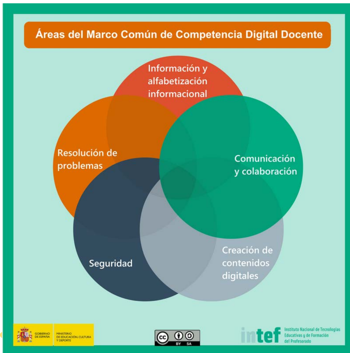
Figura 3 - Áreas del Marco Común de Competencia Digital Docente.