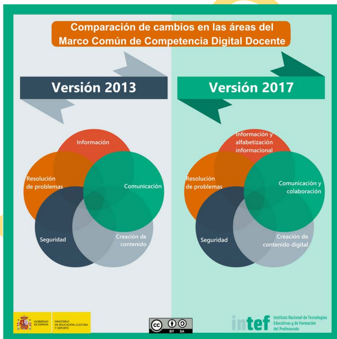
Figura 1 - Comparación de cambios en las áreas del Marco Común de Competencia Digital Docente.

Tras las conclusiones a la comparativa explicadas en el apartado anterior, se publica en octubre de 2014 la v2.0 del borrador del Marco consensuado, versión que se traduce al inglés en 2015 y sobre la cual se avanza a partir de mayo de 2016, hasta llegar una actualización 2.1., en noviembre de 2016, en la que se desarrollan los descriptores de cada una de las competencias de cada una de las cinco áreas, se redefinen los tres niveles generales de cada competencia, y se definen los seis subniveles competenciales. Esta versión 2.1 se somete a la validación de expertos entre el 30 de noviembre y el 15 de diciembre de 2016, y con las conclusiones extraídas se publica el nuevo Marco de la Competencia Digital Docente en 2017.