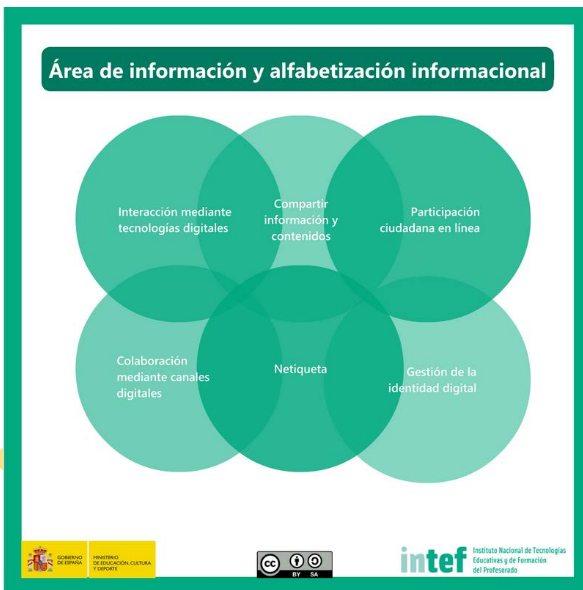
Figura 5 - Área de información y alfabetización informacional.

Comunicar en entornos digitales, compartir recursos a través de herramientas en línea, conectar y colaborar con otros a través de herramientas digitales, interactuar y participar en comunidades y redes; conciencia intercultural.