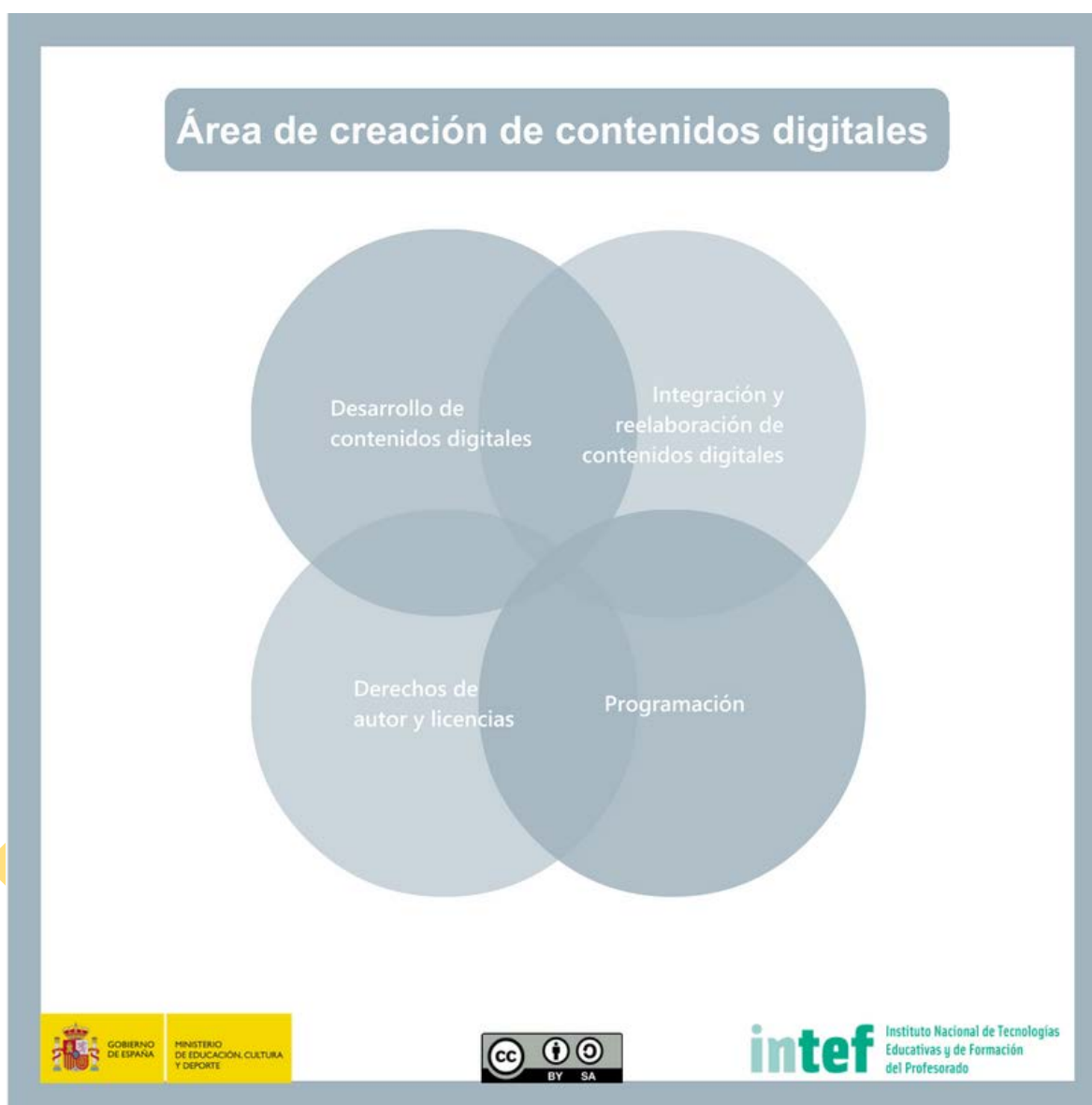
Figura 6 - Área de creación de contenidos digitales.

Crear y editar contenidos digitales nuevos, integrar y reelaborar conocimientos y contenidos previos, realizar producciones artísticas, contenidos multimedia y programación informática, saber aplicar los derechos de propiedad intelectual y las licencias de uso.