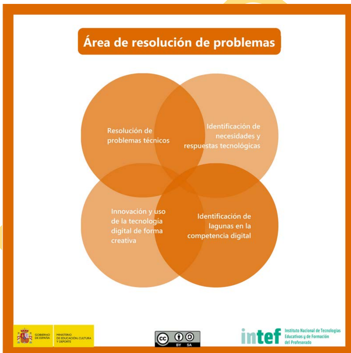
Figura 8 - Área de resolución de problemas.

Identificar necesidades de uso de recursos digitales, tomar decisiones informadas sobre las herramientas digitales más apropiadas según el propósito o la necesidad, resolver problemas conceptuales a través de medios digitales, usar las tecnologías de forma creativa, resolver problemas técnicos, actualizar su propia competencia y la de otros.