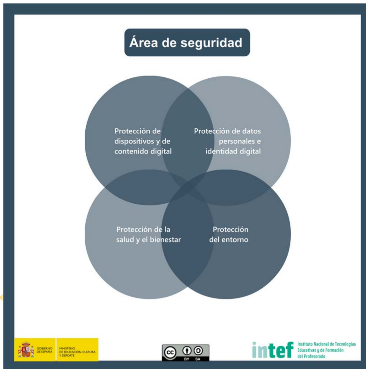
Figura 7 - Área de seguridad.

Protección de información y datos personales, protección de la identidad digital, de los contenidos digitales, medidas de seguridad, uso responsable y seguro.