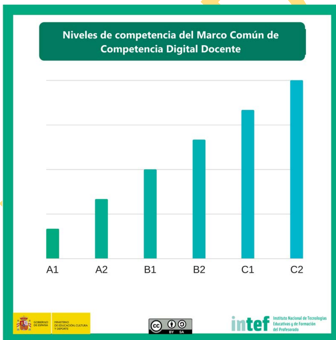
Figura 2 - Niveles de competencia del Marco Común de Competencia Digital Docente.