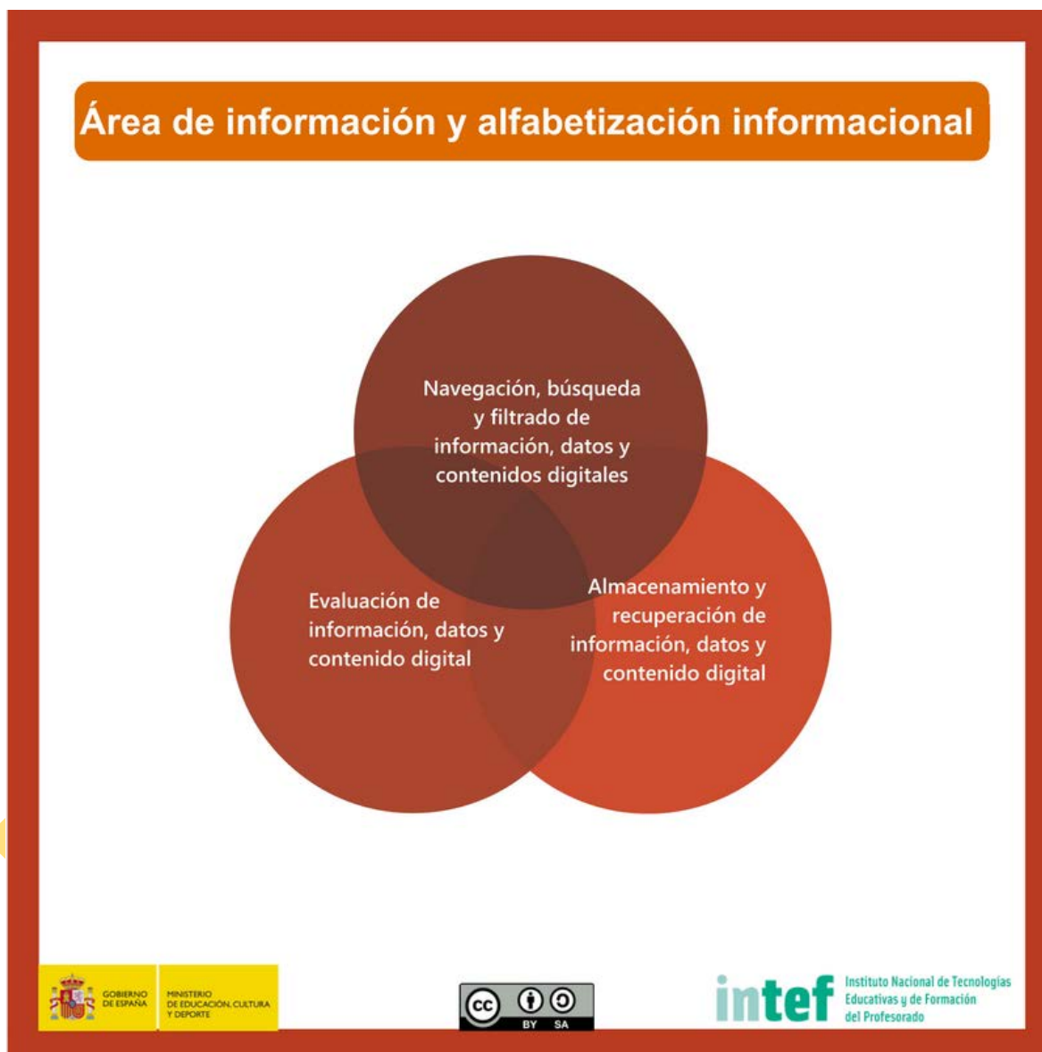
Figura 4 - Área de información y alfabetización informacional.

Identificar, localizar, obtener, almacenar, organizar y analizar información digital, datos y contenidos digitales, evaluando su finalidad y relevancia para las tareas docentes.